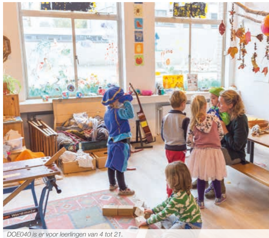
DOE040 is er voor leerlingen van 4 tot 21.